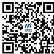
28.对公线上购买理财操作流程