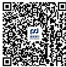
公司网银代发签约操作指南