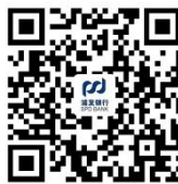
22.对公开户微信预约指引

③ 咨询办 ：客户可于营业时间内拨打我行各网点联系电话或浦发银行客服电话 95528 咨询投诉。